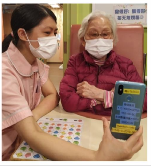
老友記與家人進行視像通話，交換近況，互相關懷。