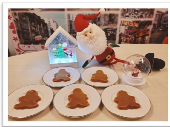
院舍推行「回味」流心軟餐 - 「薑餅人」，慶祝「聖誕節」。