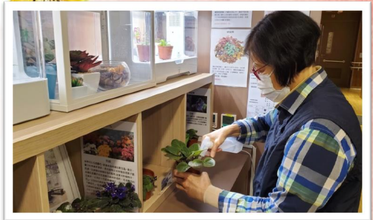
老友記專注地打理盆栽，樂在其中。