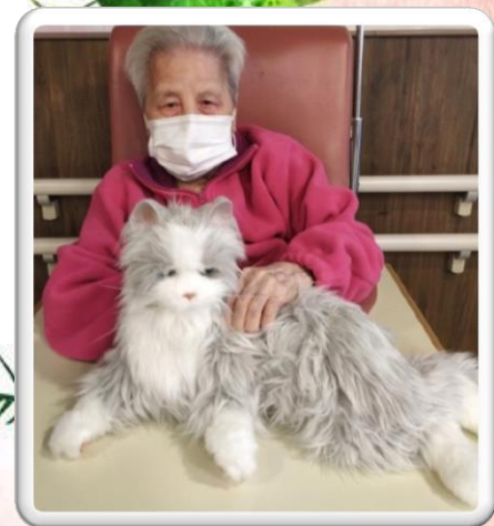
機械貓「小銀」與老友記互動，令人愛不惜手。