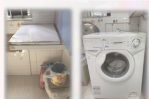
購買前 購買家電 購買後

計劃提供家居修葺、購買家電、購買傢具、購買禦寒物品等居家支援，讓申請人能安全、健康地於社區生活。受惠對象包括 50 歲或以上 有經濟困難之社區人士、同住的家人因健康或特殊社會因素而未能供應其生活所需。如有需要申請，請向職員查詢。