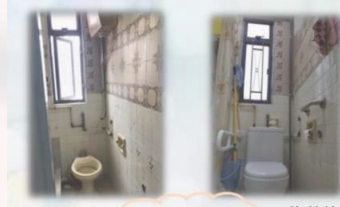
修葺前 小型修葺 修葺後