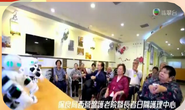
保良局西營盤護理老院暨長者日間護理中心