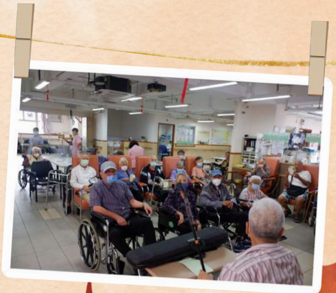
《創藝同行-音樂欣賞》 聆聽懷舊樂曲 保持心境開朗