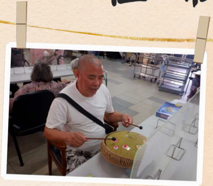
《心靈療癒鼓班》 遊玩空靈鼓 放鬆身心