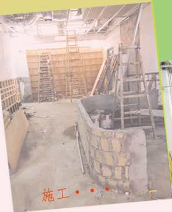
施工 . . .