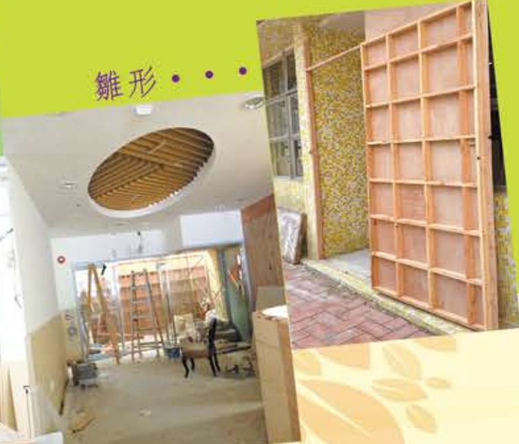
雛形 . . .