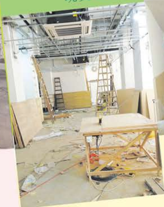
蛻變 . . .