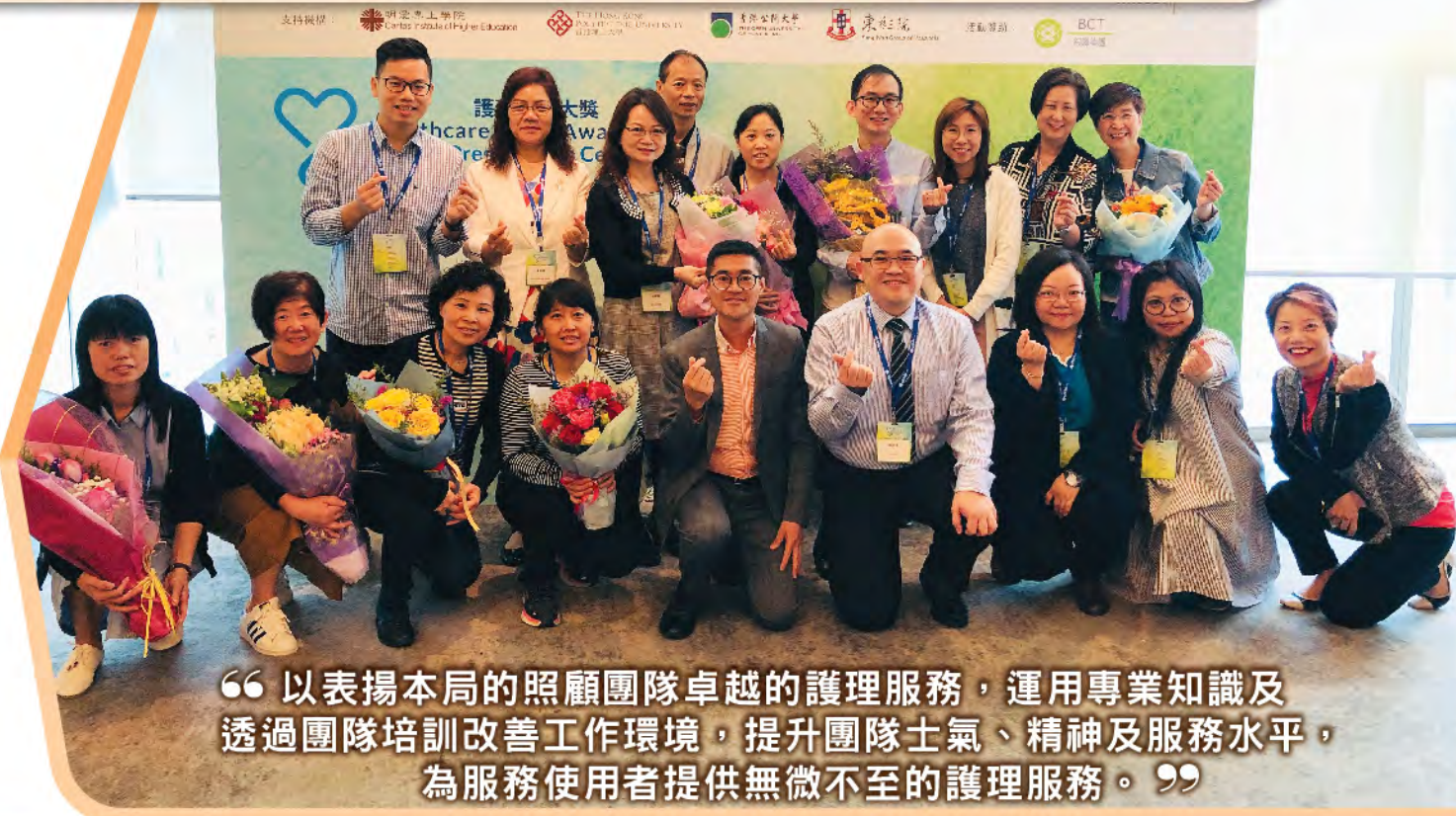
“以表揚本局的照顧團隊卓越的護理服務，運用專業知識及透過團隊培訓改善工作環境，提升團隊士氣、精神及服務水平，為服務使用者提供無微不至的護理服務。”

社區券團隊早於2013年9月開始提供服務，發展至今共21個單位，職員人數達120名。現為超過300名長者提供不同類型的服務，可見其成就廣獲業界肯定與認同。 本局長者社區照顧服務券團隊榮獲由《Classified Post》、cpjobs.com及《招職》攜手舉辦的護理精神大獎2018「護士/護理員(團隊)精神獎」。