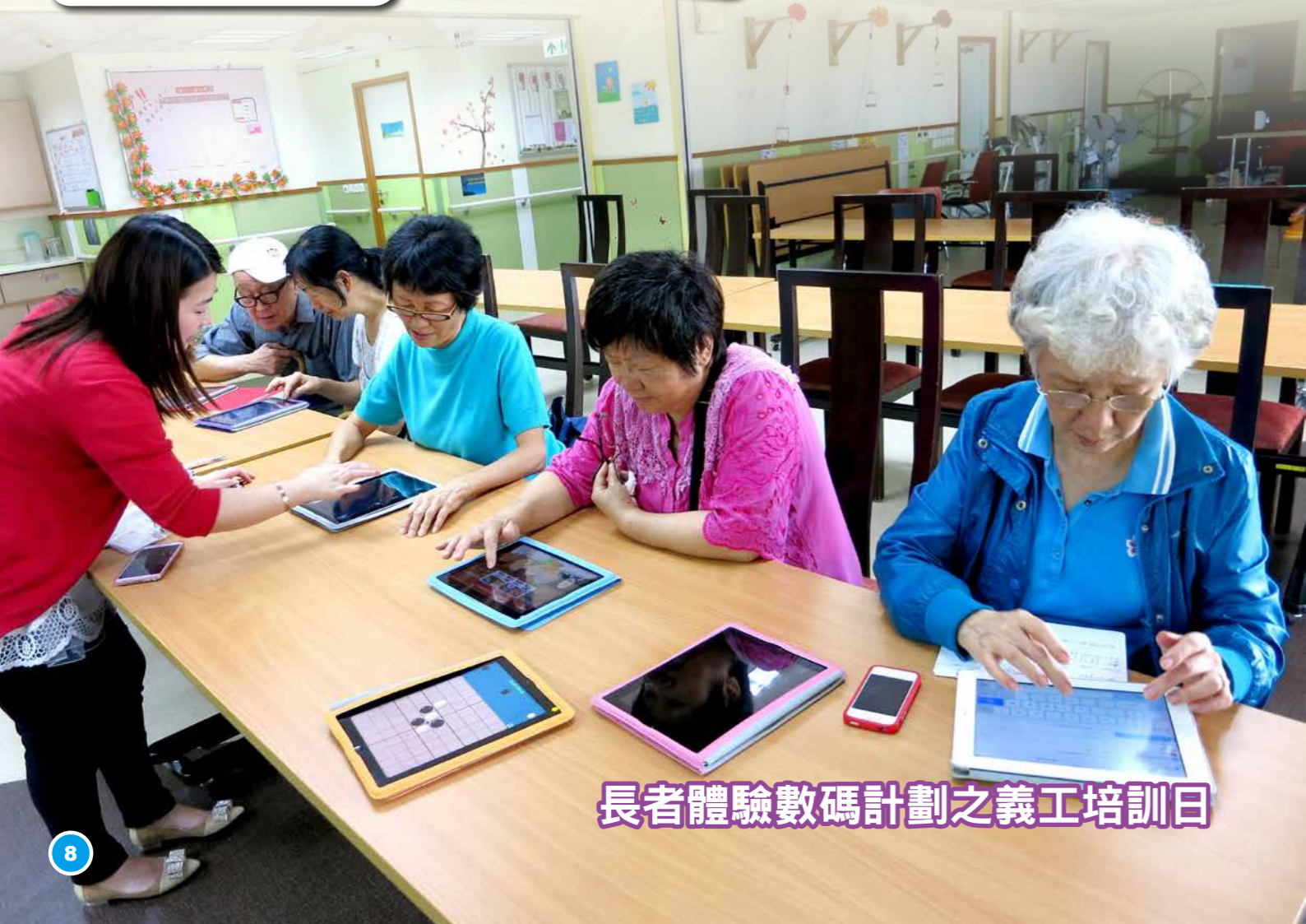
長者體驗數碼計劃之義工培訓日