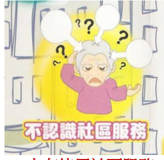
未有使用社區服務