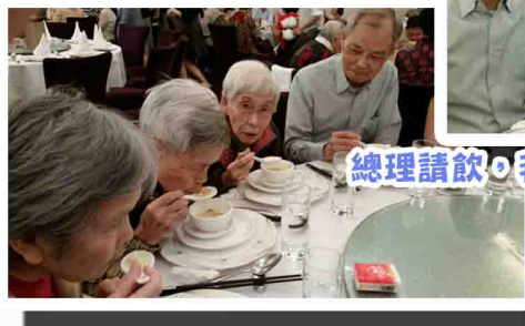
總理請飲，我哋緊係要成家人一齊去啦！