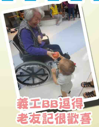
義工BB逗得老友記很歡喜