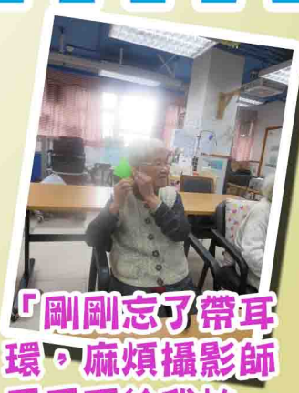
「剛剛忘了帶耳環，麻煩攝影師哥哥再給我拍一張！」