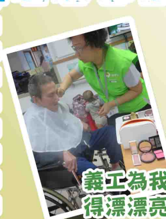
義工為我們化妝扮得漂漂亮亮去拍照！