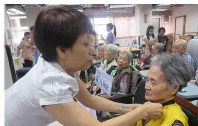
「事頭婆」幫我呢個學生哥帶上袋咗，好抵錫呀！