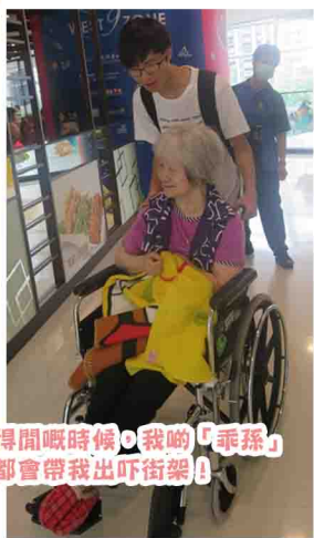
得閒嘅時候，我啲「乖孫」都會帶我出吓街架！