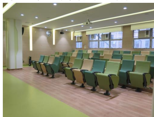
現時設施更齊備，容納更多人的劇場