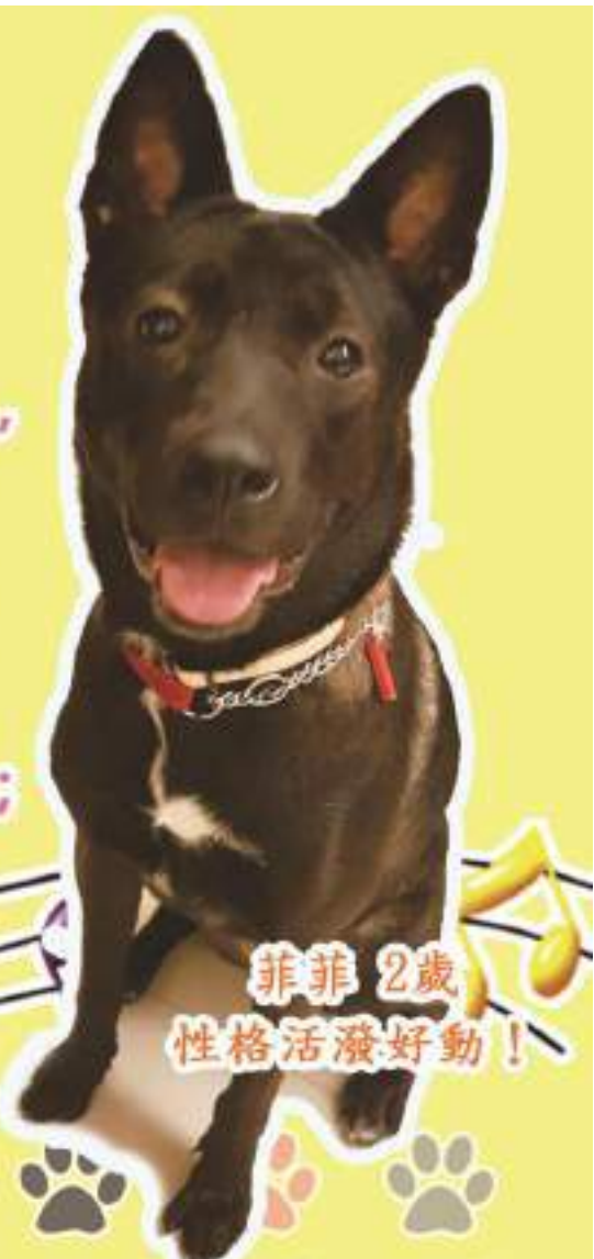
菲菲 2歲 性格活潑好動！