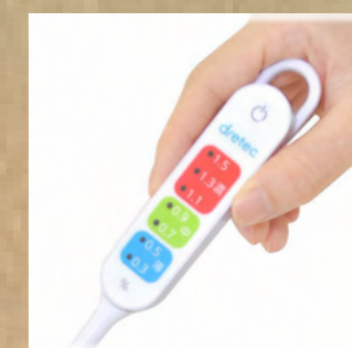
鹽份計 (Salt Meter)